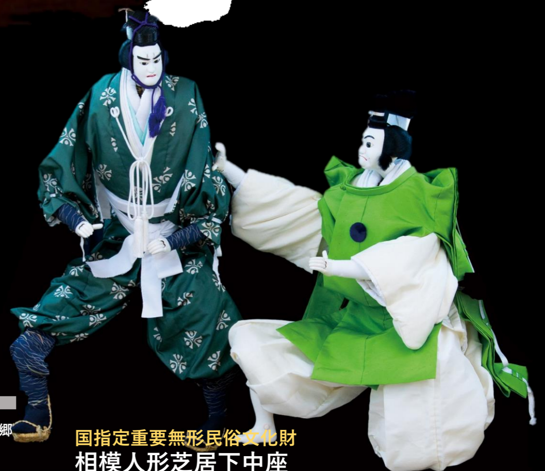
国指定重要無形民俗文化財 相模人形芝居下中座